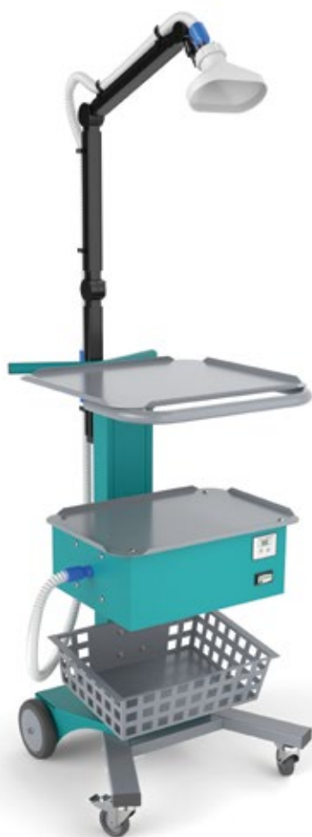
Аспиратор дыма ZERTS ASP mini