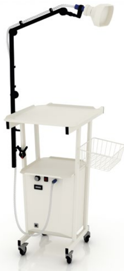
Аспиратор дыма ZERTS ASP